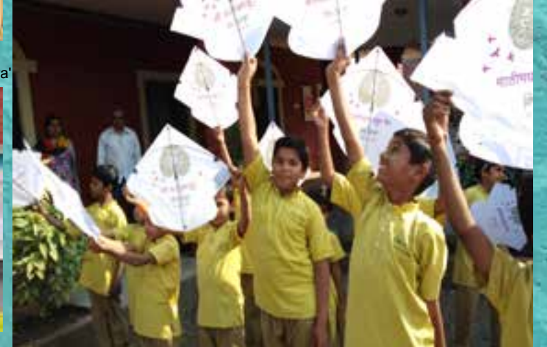
पतंग महोत्सव | Kite Festival