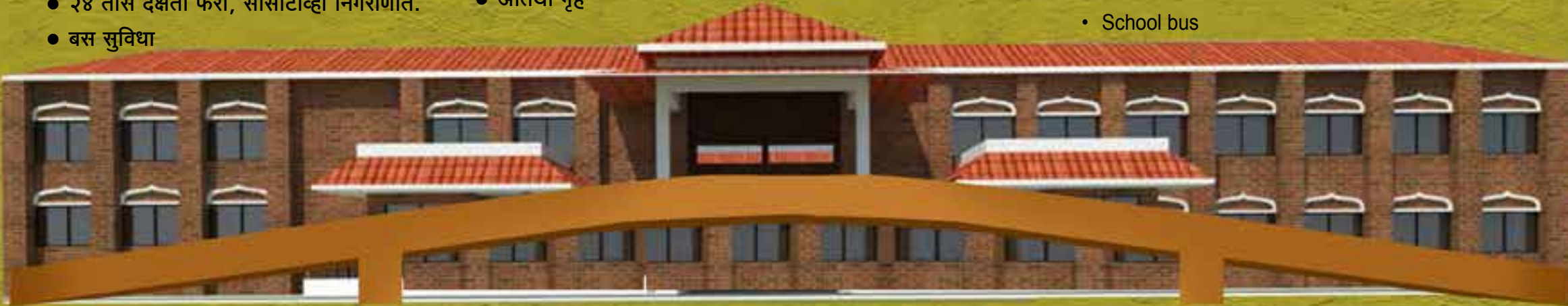
विद्या-आरण्यम् शाळेची मुख्य इमारत