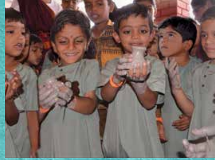
कुंभार कला | Pottery