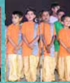
विद्यार्थी ‘भव्यशून्य’ गातांना Students singing ‘Bhavshunya’