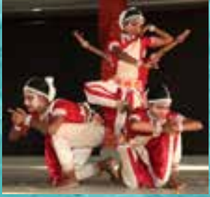
‘गोटीपुआ’ नृत्य | ‘Gotipua’ Dance