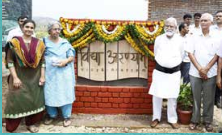
विद्या-अरण्यम्चा शुभारंभ | Inauguration of Vidyā-Aranyam