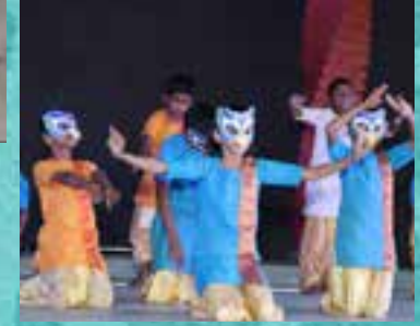
‘सप्तस्वर’ नृत्य नाटिका ‘Saptswar’ Dance Drama