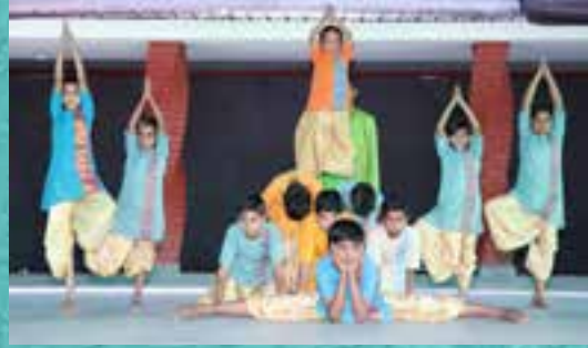
‘योगदर्शन’ | ‘Yogdarshan’