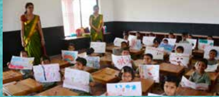
चित्रकला | Drawing