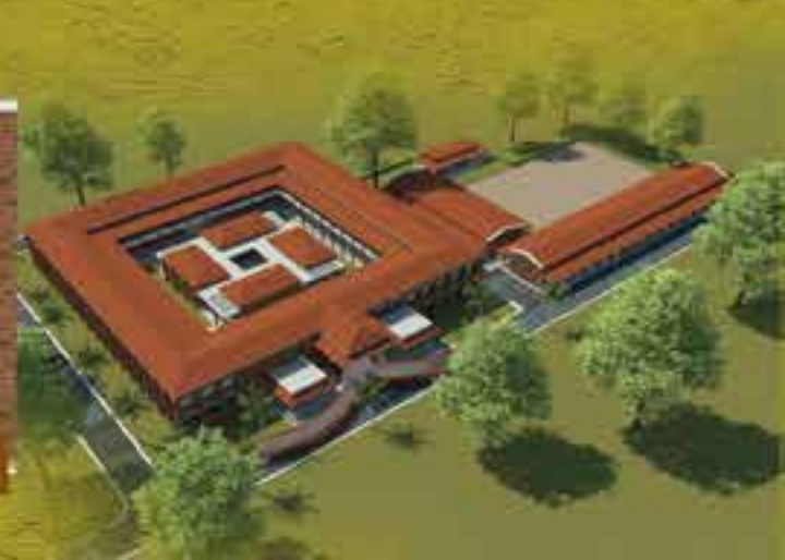
Main Building of Vidyā-Araṇyam