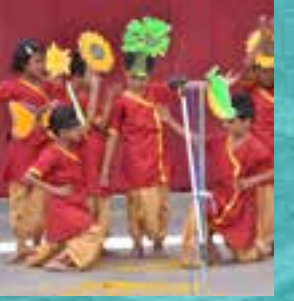
नाटक | Drama