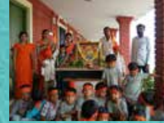
शिवजयंती | Shivjayanti