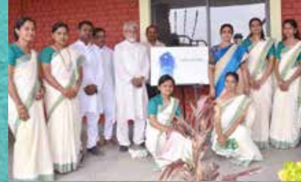
शिक्षक-वृंद | Teachers