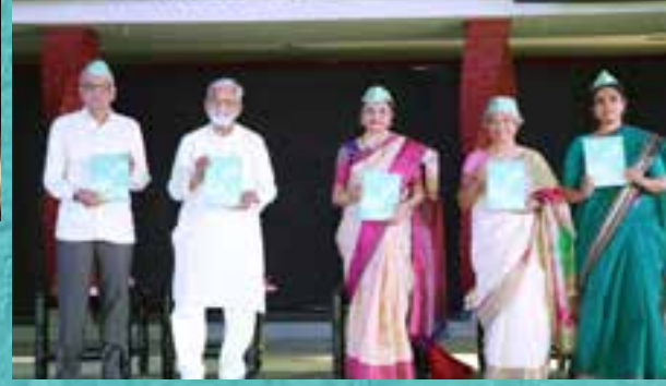
‘पंख’ वार्षिक अंकाचे विमोचन | Release of Publication ‘Pankh’